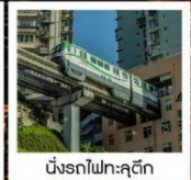
นังกรไฟทะเลตุ๊ก