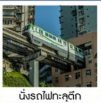
นั่งรถไฟทะลุติ๊ก