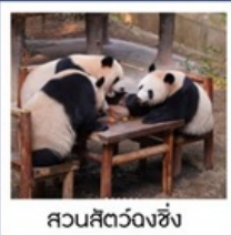
สวนสัตว์ฉงชิ่ง

สวนสัตว์ฉงชิ่ง • เมืองโบราณซือปาเก้ • หมู่บ้านโบราณฉือซีชี่ว • มหาศาลาประชาคม นั่งรถไฟทะลุติ๊ก • ถนนโบราณหลงเหมินเฮ่า • ถนนเซี่ยเฮ่าหลี • วัดหลิวอัน • Raffles City • หงหยาดัง ถนนคนเดินเจี่ยฟ่างเป็ย POP MART • ล่องเรือแม่น้ำแยงซีเกียง • พิพิธภัณฑ์ศิลปะฉงชิ่ง • ตึกชวยซิง 22 ชั้น • THE RING MALL