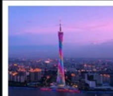
แคนตันทาวเวอร์