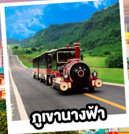
ภูเขาฉางฟ้า