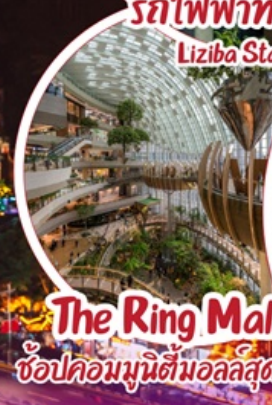
The Ring Mall