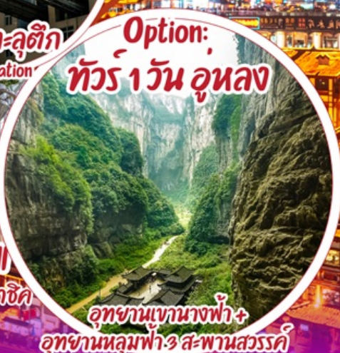
Option: ทัวร์ 1 วัน อุนหลง