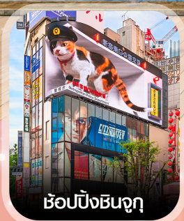
ช้อปปังชินจูกุ

✈️ คอนเฟิร์มออกเดินทาง ทุกพีเรียด 2 ท่านขึ้นไป