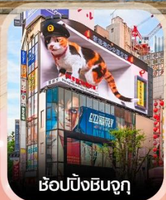
ซ้อปป์ชินจูกุ

✈️ คอนเฟิร์ม ออกเดินทาง ทุกพีเรียด 2 ท่านขึ้นไป