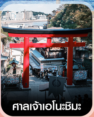
ศาลเจ้าเอโนะชิมะ