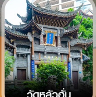
วัดหลิวอัน