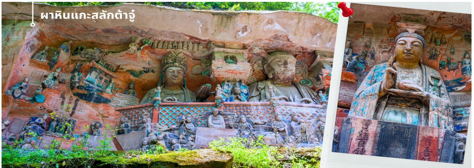
ผาหินแกะสลักต้าจู่

จากนั้นนำท่านเดินทางสู่ ผาหินแกะสลักต้าจู่ เขาเป่าตังซาน ผาหินแกะสลักที่ได้รับการบันทึกให้เป็นมรดกโลกทางวัฒนธรรม ที่ผสมผสานบนความเชื่อด้านศาสนาและเป็นงานศิลปะที่ผสมผสาน จุดเด่นของเมืองต้าจู่ที่แสดงถึงงานฝีมือในการแกะสลักถ้ำและผาหิน กลุ่มผาหินแกะสลักต้าจู่มีมากกว่า 70 จุด ชิ้นงานมากกว่า 1 แสนชิ้น ในนั้นถือว่า “เป่าตังซาน” และ “เป่ยซานม่อหย่า” สองสถานที่นี้มีหินแกะสลักชิ้นซื่อกมากที่สุด เน้นไปทางพุทธศาสนาเป็นแบบอย่างของถ้ำหินแกะสลักของประเทศจีนในยุคศิลปะตอนปลาย และ หินแกะสลักเป่าตังซาน เป็นตัวหลักในการขุดเจาะแกะสลักอย่างยากลำบากกว่า 70 กว่าปี หินแกะสลักที่นี้จะแกะตามรูปลักษณะของตัวภูเขา ด้วยความปราณีต และพิถีพิถัน มีความสวยงามเพียบพร้อมด้วยเนื้อหาบอกเล่าและเตือนสติผู้พบเห็น และยังมีการจัดแบ่งงานฝีมือของแต่ละยุคไว้ เป็นการประชันของช่างในแต่ละยุค ด้านใต้จะเป็นงานในยุคถึงตอนปลาย จนถึง ยุคห้ารัชกาล และ ด้านเหนือจะเป็นงานในสมัย ช่งเหนือซึ่งได้ ซึ่งงานฝีมือในแต่ละยุคจะสะท้อนความเป็นอยู่และค่านิยมที่ไม่เหมือนกัน