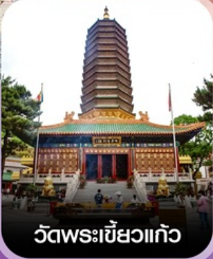
วัดพระเขี้ยวแก้ว