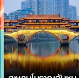
สะพานโบราณอันชุน