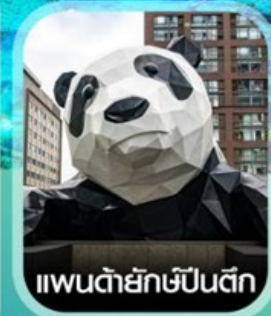
แพนด้ายักษ์ปิ่นตีก