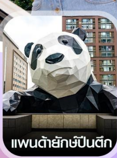
แพนด้ายักษ์ป็นตึก