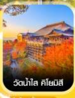
วัดน้ำใส คิโยมิสึ