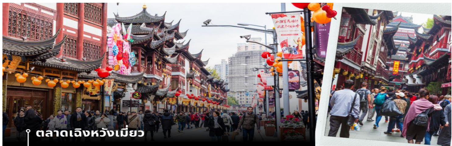
ตลาดเฉินหวังเหมียว

นำท่านเดินทางสู่ หมู่บ้านโบราณจูเจียเจียว มีฉายาว่า เวนิซตะวันออกแห่งเมืองเซี่ยงไฮ้ เป็นอีกหนึ่งย่านเก่าริมน้ำที่มีชื่อเสียงในเซี่ยงไฮ้ มีประวัติศาสตร์ยาวนานกว่า 1700 ปี ซึ่งพื้นที่ทั้งหมดได้รับการอนุรักษ์ไว้เป็นอย่างดี จุดเด่นของเมืองโบราณแห่งนี้คือพื้นที่ด้านในนั้นมีแม่น้ำหลากหลายสายเชื่อมโยงไปยังพื้นที่ต่างๆ โดยรอบ ทำให้มีบรรยากาศที่สวยงามและร่มรื่น และให้ท่าน ล่องเรือ ชมวิวบ้านเรือนเก่าแก่ริมน้ำ ได้เวลาอันสมควรเดินทางสู่ มหานครเซี่ยงไฮ้ จากนั้นนำท่านสู่ ตลาดโบราณ 100 ปี เฉินหวังเหมียว เป็นศูนย์รวมสินค้า และอาหารพื้นเมืองที่แสดงถึงเอกลักษณ์ของชาวเซี่ยงไฮ้ซึ่งมีการผสมผสานระหว่างอดีตและปัจจุบันได้อย่างลงตัว ซึ่งเป็นย่านสินค้าราคาถูกที่มีชื่ออีกย่านหนึ่งของนครเซี่ยงไฮ้ ให้ท่านอิสระช้อปปิ้งตามอัธยาศัย