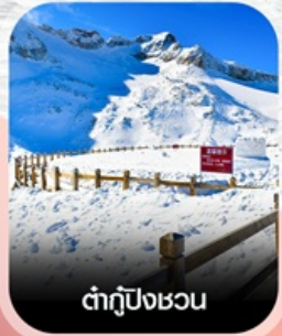
ต้ากู่ปิงชอน