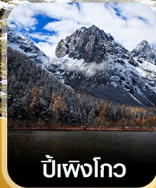
ปี้เฟิงโกว