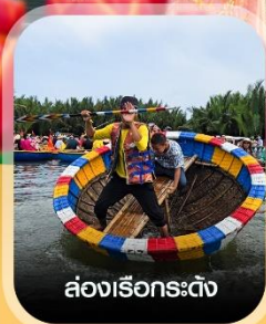
ล่องเรือกระดิ่ง

✈️ คอนเฟิร์ม ออกเดินทาง ทุกพีเรียด 2 ท่านขึ้นไป