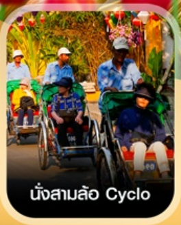
นั่งสามล้อ Cyclo