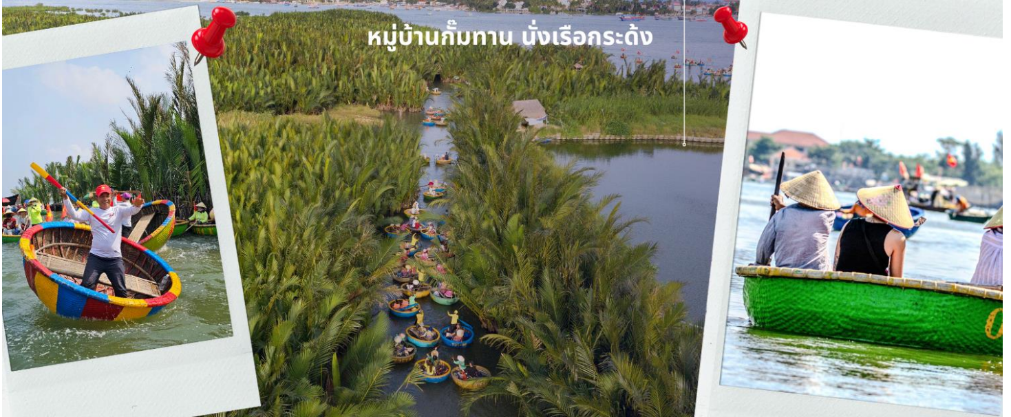
หมู่บ้านกัมทาน นั่งเรือกระดัง

จากนั้นนำท่านผ่านชม ภูเขาหินอ่อน Marble Mountains นำท่านเดินทางสู่ หมู่บ้านกัมทาน สนุกสนานไปกับการเล่นกิจกรรม นั่งเรือกระดัง เป็นหมู่บ้านเล็กๆในเมืองฮอยอันตั้งอยู่ในสวนมะพร้าวริมแม่น้ำ ในอดีตช่วงสงครามที่นี่เป็นที่พักอาศัยของเหล่าทหาร อาชีพหลักของคนที่นี่คืออาชีพประมง ระหว่างการล่องเรือท่านจะได้ชมวัฒนธรรมอันสวยงาม ชาวบ้านจะขับร้องเพลงพื้นเมือง ผู้ชายกับผู้หญิงจะหยอกล้อกันไปมาหน้าที่พายเรือมาเคาะกันเป็นจังหวะดนตรีสุดสนุกสนาน จากนั้นนำท่านเดินทางสู่ เมืองโบราณฮอยอัน เทียบชมเมืองมรดกโลก