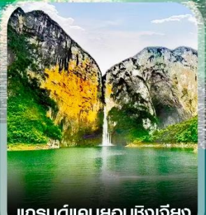
แกรนด์แคนยอนซิงเจียง