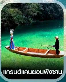
แกรนด์แคนยอนผิงชาน