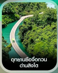
อุทยานซีจื่อกวน ด่านสิงโต