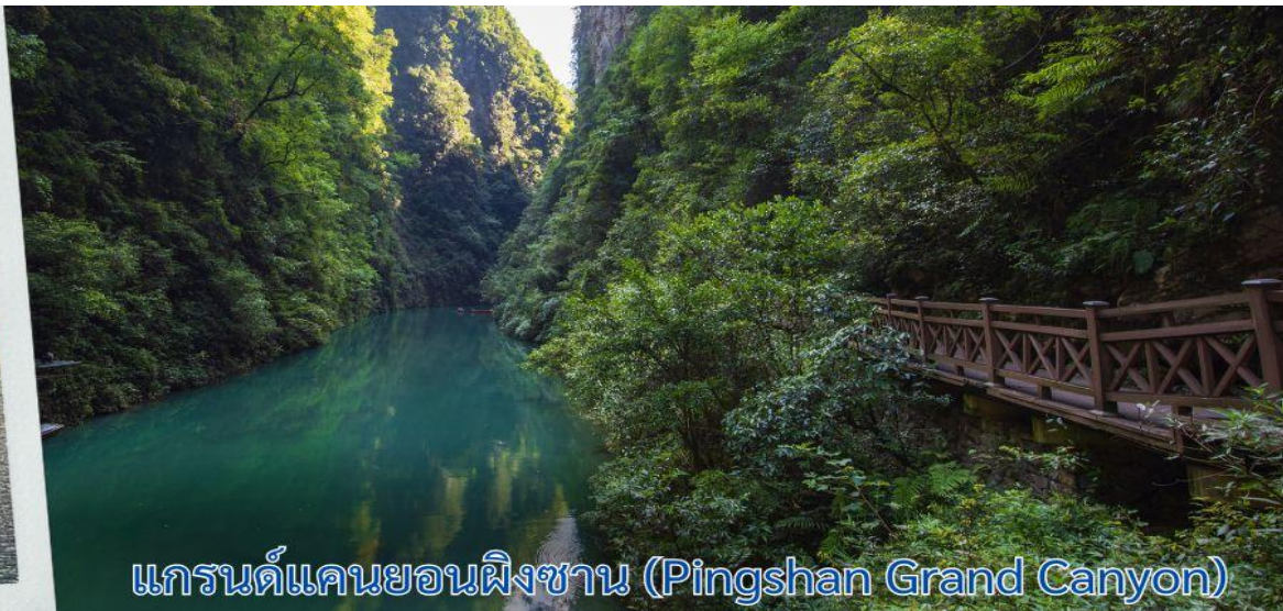
แกรนด์แคนยอนผิงซาน (Pingshan Grand Canyon)

เที่ยง รับประทานอาหารกลางวัน ณ ภัตตาคาร (6)