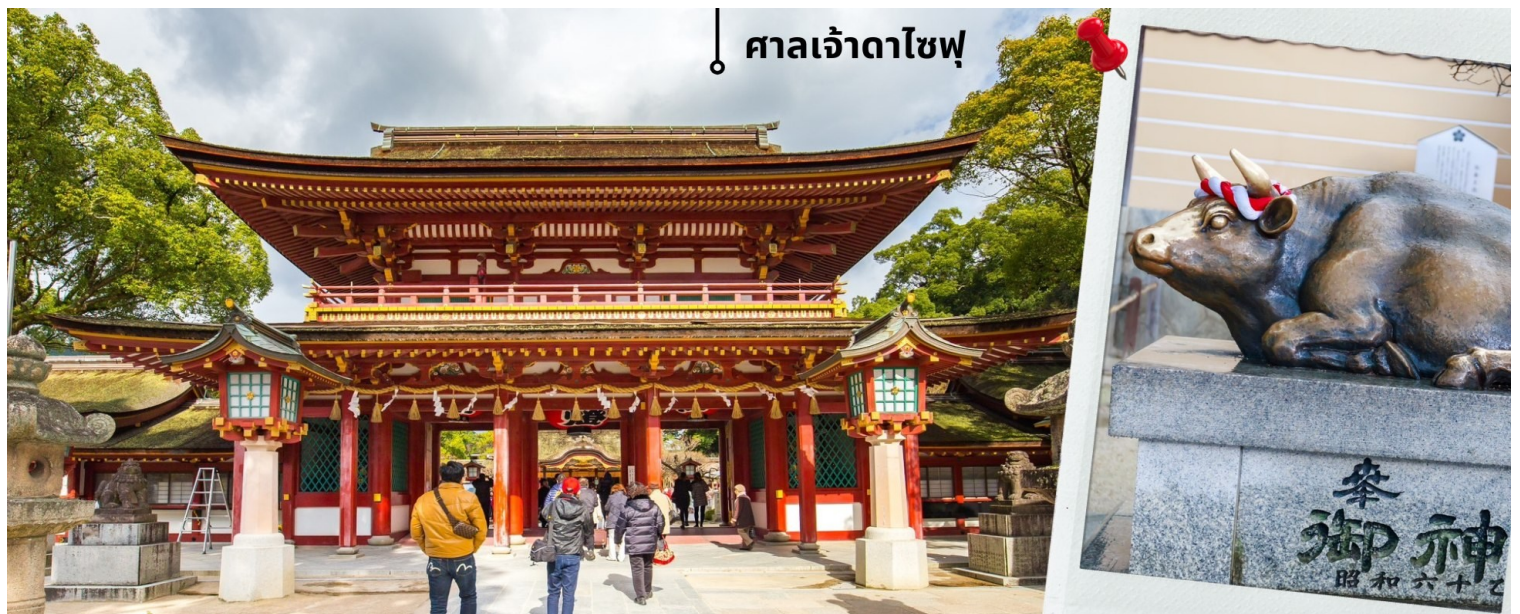
ศาลเจ้าดาไซฟุ

07.55 น. เดินทางถึงสนามบินนานาชาติฟุกุโอกะ ประเทศญี่ปุ่น หลังจากผ่านพิธีตรวจคนเข้าเมืองและศุลกากรแล้ว นำท่านขึ้นรถโค้ชปรับอากาศ จากนั้นเดินทางสู่ เมืองฟุกุโอกะ นำท่านเดินทางสักการะขอพรที่ ศาลเจ้าดาไซฟุ ศาลเจ้าแห่งนี้สร้างขึ้นสักการะเทพเท็นจิน เทพเจ้าแห่งการศึกษาของญี่ปุ่น อยู่ที่เมืองดาไซฟุ จังหวัดฟุกุโอกะ มีความสวยงามและประวัติศาสตร์ที่น่าสนใจ หนึ่งในไฮไลท์ที่ดึงดูดให้นักท่องเที่ยวมาที่นี่คือ สะพานไทโคบาชิ (Tai Ko Bridge) ที่มีลักษณะเป็นสะพานสีแดงสด เรียงต่อกัน 2 สะพาน โดยเป็นสัญลักษณ์ของ “อดีต - ปัจจุบัน - อนาคต” และอีกหนึ่งจุดที่คนนิยมมาถ่ายรูปกันก็คือ การมาลูปหัวรูปปั้นวัว ที่ศาลเจ้า นอกจากจะมีศาลเจ้าให้ไหว้สักการะแล้ว ยังมีสถาปัตยกรรมที่งดงาม และร้านอาหารอร่อยๆให้ได้ลองอีกด้วย