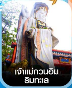
เจ้าแม่กวนอิม ริมทะเล

100% GUARANTEE 100% GUARANTEE การ์ตูนพิภพย่านช้อปปิ้ง