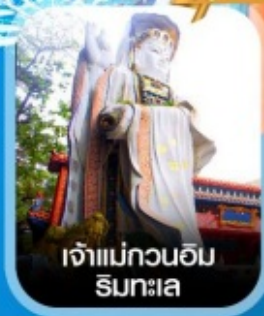
เจ้าแม่กวนอิม ริมาทะเล

✈️ คอนเฟิร์ม ออกเดินทาง ทุกพีเรียด 2 ท่านขึ้นไป