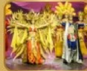
ชมการแสดงละครเวที