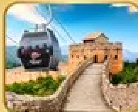
ถ่ายภาพเมืองจีน