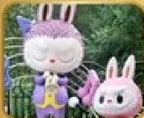
เที่ยวสวนสนุก