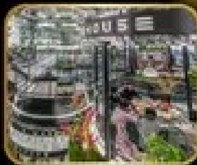
ร้านอาหาร เริ่มต้น WAREHOUSE NO.3