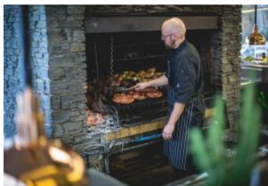
รับประทานอาหารกลางวัน บาร์บีคิว ณ วอลเตอร์พีคฟาร์ม