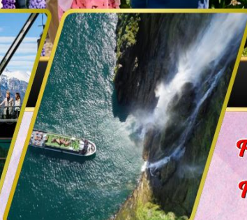
ล่องเรือมิลฟอร์ด ซาวน์