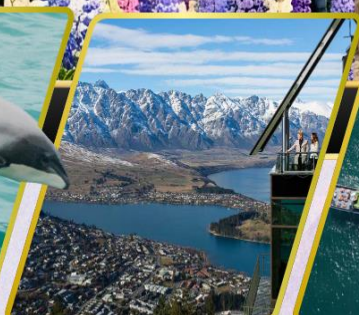
ยอดเขานีออนส์พีค