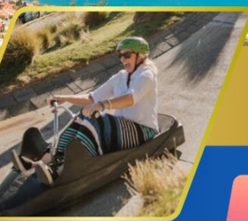
เล่นจุก ที่ควีนส์ทาวน์

บินภายใน (เที่ยวสุดคุ้ม) พักโรงแรม 4 ดาว ★★★★★