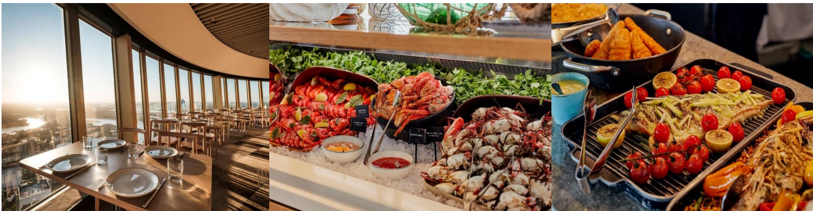
* รูปเพื่อการโฆษณาเท่านั้น *

คำ นำท่านขึ้นหอคอยชิตินีย์ พร้อมรับประทานอาหาร แบบบุฟเฟต์นานาชาติ SKYFEAST AT SYDNEY TOWER RESTAURANT พร้อมชมวิวของนครชิตินีย์อันสวยงามในยามเย็น