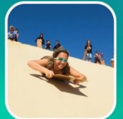
เล่นกระดานทรายจากยอดเนินทรายสูงชัน