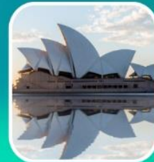
ซิดนีย์, โอเปร่าเฮาส์