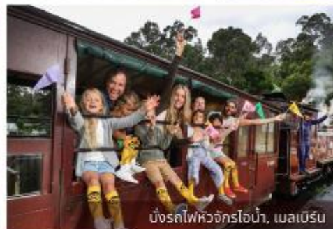
มิ่งรถไฟหิวจักรไอน้ำ, เมลเบิร์น