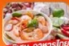
พิเศษ อาหารไทย