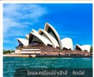
โรงละครโอเปร่าเฮ้าส์, ซิดนีย์