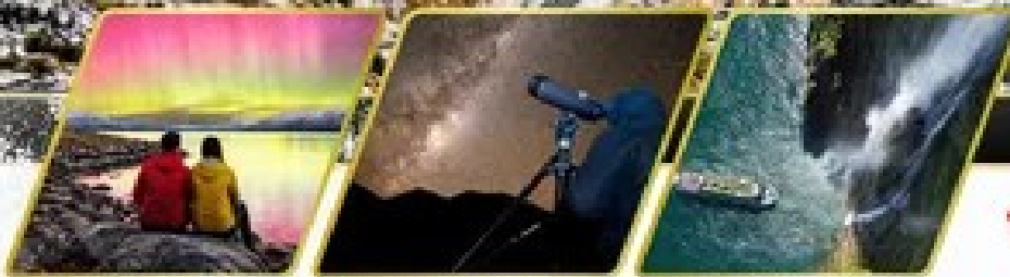
ตามล่าหาแสงใต้