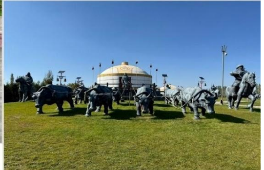
เขตท่องเที่ยวเจงกิสข่าน • กลุ่มประติมากรรม กองทัพเหล็กและกระโจมทอง