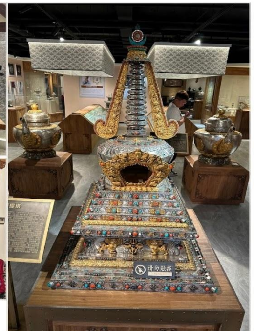
ร้านเครื่องเงินมองโกล