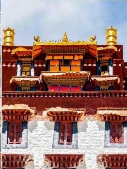
พระราชวังโปตาลา (Potala Palace)