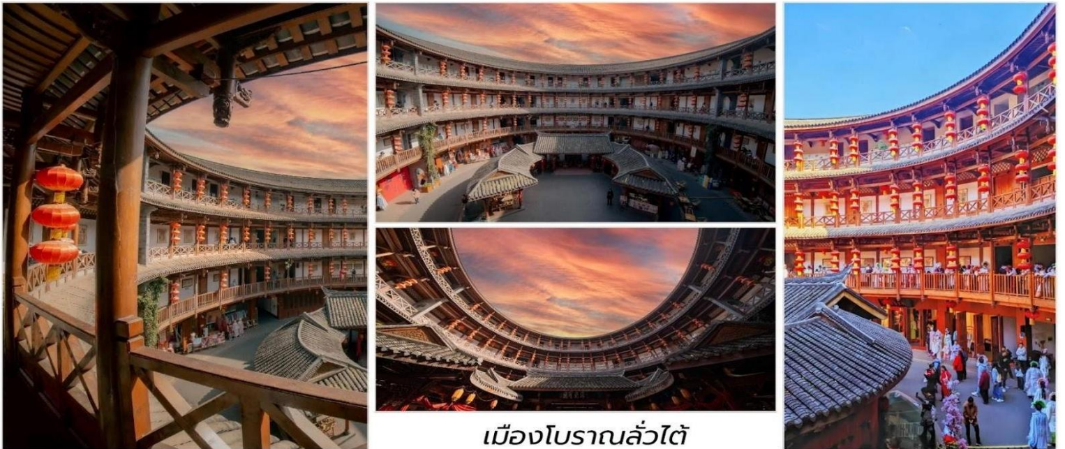
เมืองโบราณลั่วไต้

นำท่านชม เมืองโบราณลั่วไต้ เมืองนี้มีชื่อเสียงเป็นพิเศษในด้านการอนุรักษ์โบราณวัตถุ ทางวัฒนธรรมระดับชาติที่สำคัญพิพิธภัณฑ์อากาศและสวนอากาศ สถาปัตยกรรมจีนโบราณเป็นรูปแบบสถาปัตยกรรมตามแบบฉบับ ของหมิง และชิง สลักด้วยรูปปั้นมังกร ฟีนิกซ์ ดอกไม้และนกอันน่าทึ่งมีรูปร่างเหมือนจริงและฝีมือประณีต