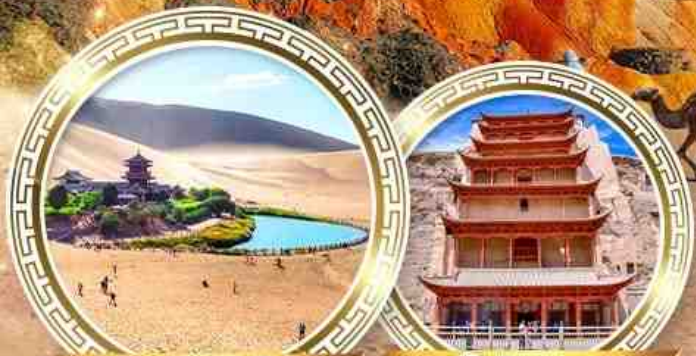
ทะเลจันทร์เสี้ยว