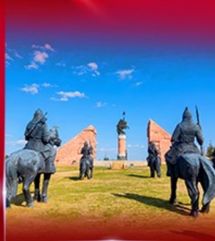
สวนสาธารณะหงกิลง่า