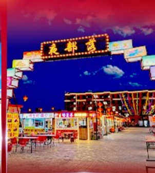
ตลาดกลางคืน ตาลาเดอดี