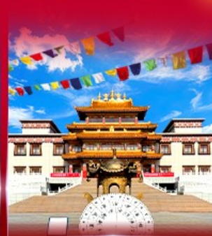
วัดพระโพธิสัตว์ อูลาน