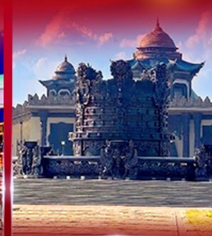
ศูนย์วัฒนธรรม มองโกเลีย หยวนหลิว