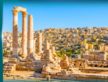
บ่อมปราการอัมมาน