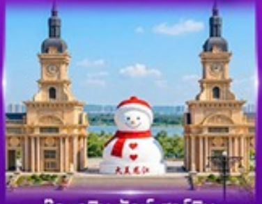
ตุ๊กตาหิมะยักษ์ ฮาร์บิน