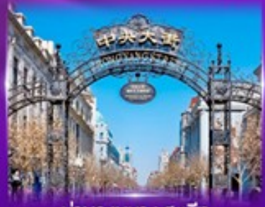
ย่านจงหยวน สตรีท