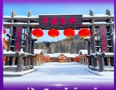
หมู่บ้านหิมะ สโนว์ทาวน์