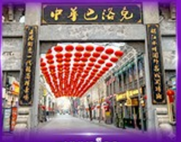
ถนนบาร์จอก