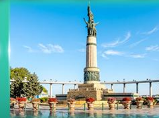
อนุสาวรีย์มังกร