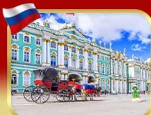
เช่าชมพิพิธภัณฑ์ออร์มิตา