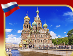
เข็ควินโบสกแห่งหอยเลือด