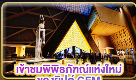
เข้าชมพิพิธภัณฑ์แห่งใหม่ ของอียิปต์ GEM