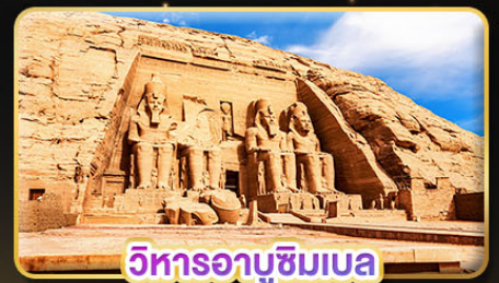
วิหารอาบูซิมเบล

น้ำหนักกระเป๋า 23Kg. (บินระหว่างประเทศ และบินภายใน)