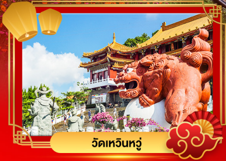
วัดหน่วหน่ว