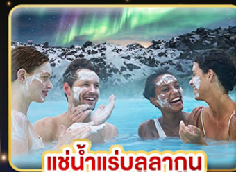
แช่น้ำแร่ลูลาทูน