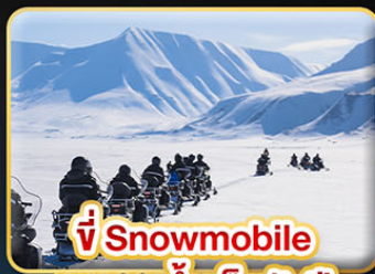
ขี่ Snowmobile บนธารน้ำแข็งพันปี