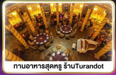
ทานอาหารสุดหรู ภัตตาคาร Turandot