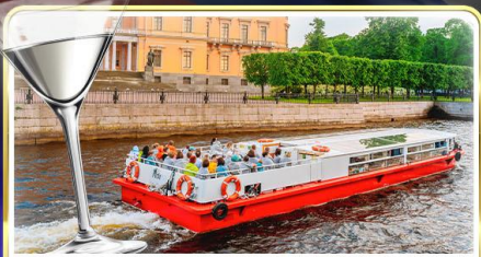
ล่องเรือแม่น้ำวอวา พร้อมเสิร์ฟ Vodka Tasting