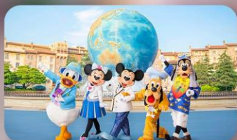
อิสระตามอริยาคิย 2 วัน

HOTEL ASIA NARITA หรือเทียบเท่ามาตรฐานญี่ปุ่น