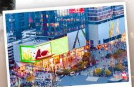
ถนนไท่กู๋หลี่หลิน