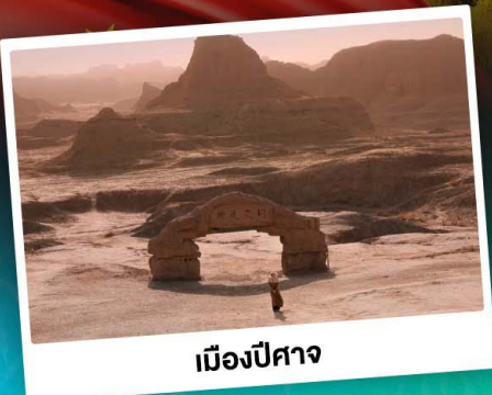
เมืองปีศาจ