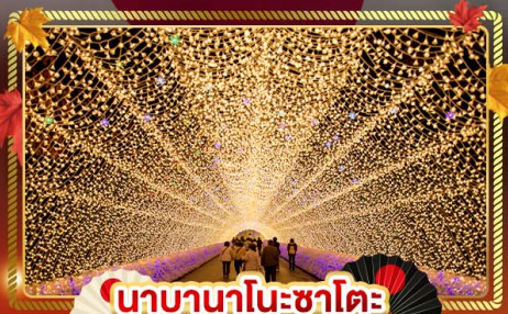
นาราในนาระซาโตะ

"ชมความงามของฤดูใบไม้เปลี่ยนแล้ว" เที่ยวครบจบทุกไฮไลท์ โอซาก้า-โตเกียว พิเศษ!! บินแอร์แบบ FULL SERVICE