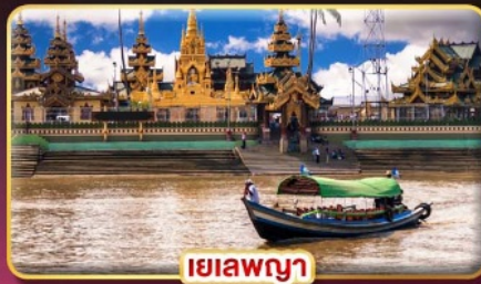
ยี่ลาพญา