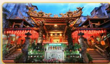
วัดเทียนโฮ่ว จอพริเจ้าแม่หม่าจู