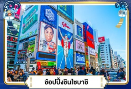
ช้อปปิ้งชินโซบาช