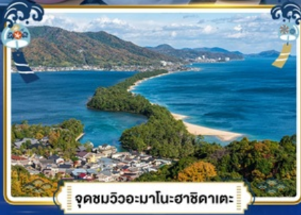
จุดชมวิວะมาโนะฮาชิคาเตะ