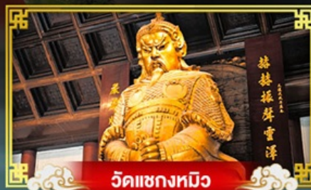
วัดเขกงทมิ้ว