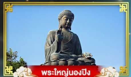
พระโทงนงปิง