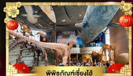
พิพิธภัณฑ์เซี่ยงไฮ้