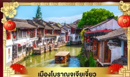
เมืองโบราณอูเจียเจียว

สนุกเต็มพิกัด "สาวเสแสบก๊าดไส้แค้นแต่เซ่งไฉ่"