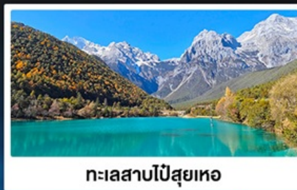
ทะเลสาบไป๋สุยเหอ