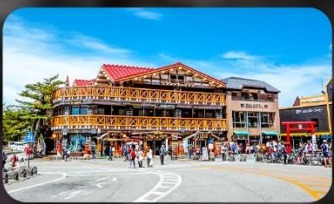
ฟูจิชั้น 5